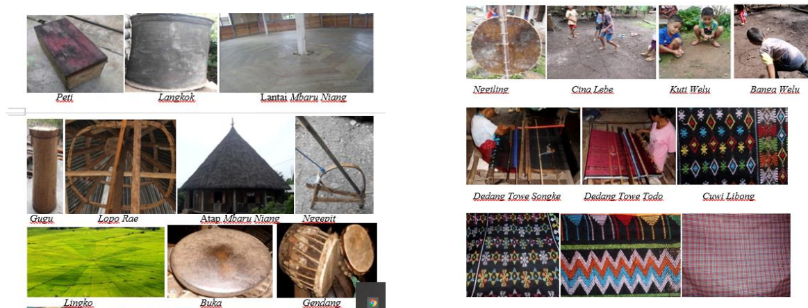
Gambar 2. Model Etnomatematika Kabupaten Manggarai

Selanjutnya, hasil validasi produk pengembangan oleh pakar dengan menggunakan instrument validasi produk oleh pakar menunjukkan bahwa produk pengembangan layak digunakan dengan tanpa revisi yang mana persentasinya berada pada interval 90%-100% dengan kualifikasi sangat baik dan rekomendasi tanpa revisi. Dengan demikian produk pengembangan ini siap untuk diujicoba. Mengingat, penelitian ini dilakukan ditengah pandemic Covid-19 yang tidak memungkinkan untuk pertemuan tatap muka karena adanya kebijakan belajar dari rumah (BDR) maka uji coba lapangan dilakukan setelah proses pembelajaran di kelas kembali normal.